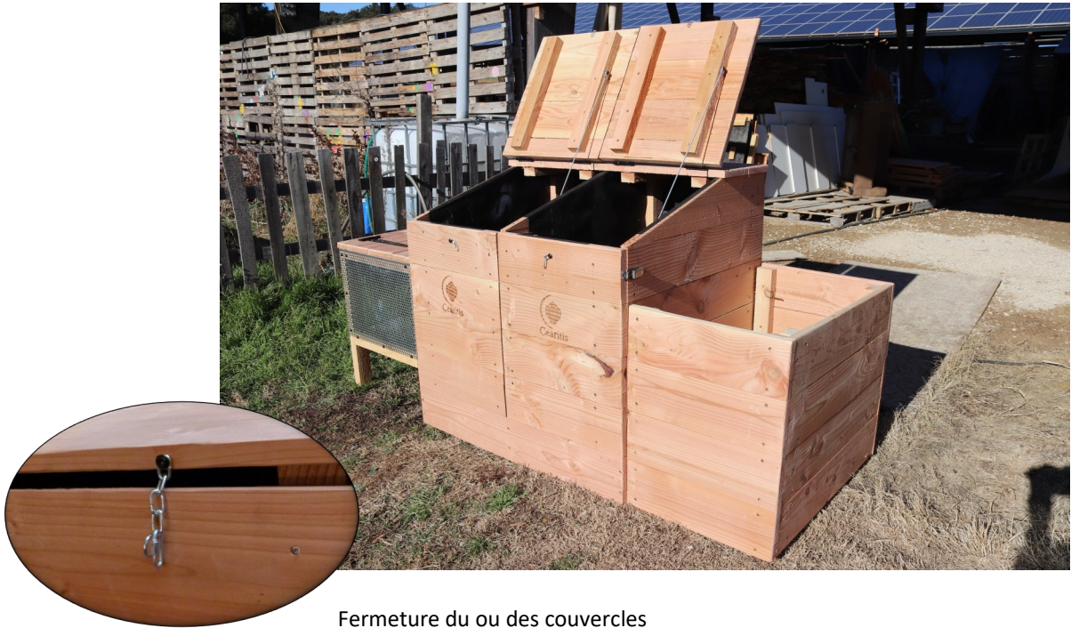
Fermeture du ou des couvercles par chaîne et maillon rapide.

Maintien des capot ouverts par de puissants câbles en acier gainé de 4mm de diamètres et tenus des vis pentures 7/45.