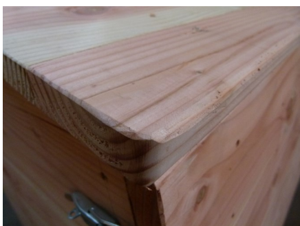
Angles arrondis et arêtes poncées

Et enfin, lorsque l'ensemble ne tiendra plus, 98% des éléments seront simplement à composter (le bois), les vis à recycler et la quincaillerie à réutiliser, il restera le liner parepluie (500g environ) et les résidus de colle pu (800g) à traiter.