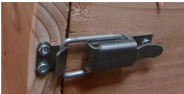
Etrier de serrage en inox (serrage dynamique)